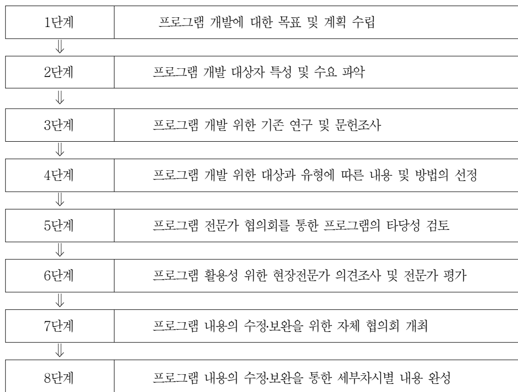
<그림 1-1> 프로그램 개발 과정

에 투입하는 경우 활용성을 조사하기 위해 다문화교육 현장전문가들의 의견을 조사하였고, 연구원들의 연구발표와 해당영역에 관련된 현장 전문가와 다문화구성원들을 초청하여, 토론을 통한 프로그램에 대한 검증과정이 있다. 제7단계에서는 연구진들이 프로그램개발의 내용구성과 수정, 보완을 위한 최종 자체 협의회를 개최한다. 제8단계에서는 모든 의견을 수렴한 프로그램 개발 및 수정, 보완을 통하여 세부차시별 프로그램을 완성한다.